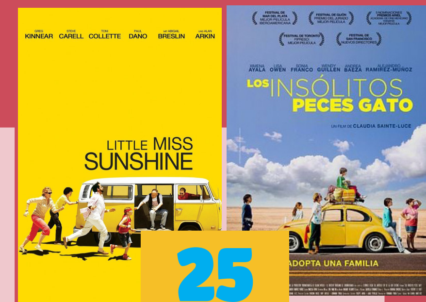
Pequeña Miss Sunshine (2006) Valerie Faris y Jonathan Dayton 101 minutos Clasificación B