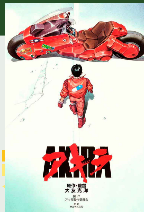
Akira (1988) Katsuhiro Otomo 124 minutos Clasificación B-15