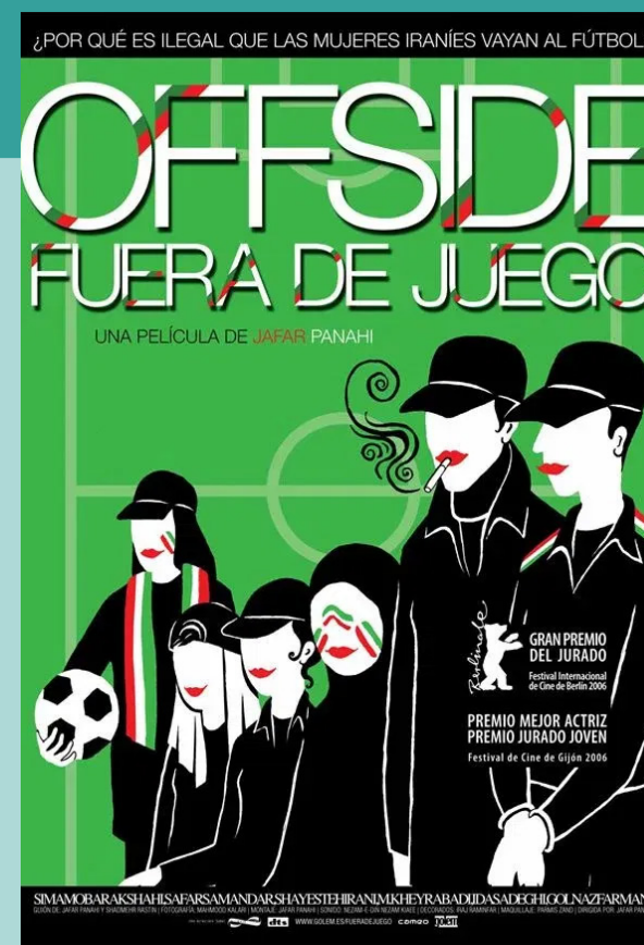
Offside (2006) Jafar Panahi 88 minutos Clasificación A