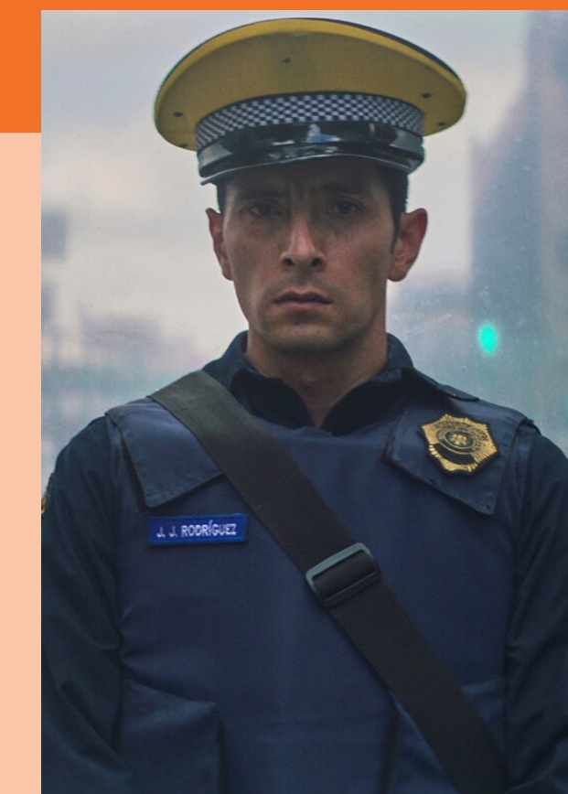
Una película de policías (2021) Alonso Ruizpalacios 107 minutos Clasificación B

Este ciclo nos invita a conocer el funcionamiento de las instituciones y por qué los servicios públicos y la justicia son importantes para la vida en comunidad.