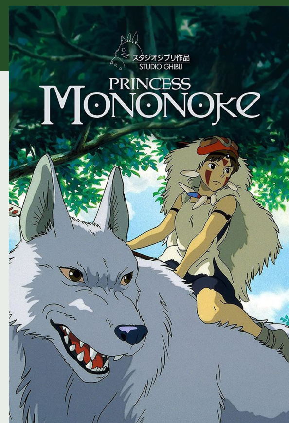
La princesa Mononoke (1997) Hayao Miyazaki 134 minutos Clasificación B

El anime invita a pensar cómo funciona el poder, la sociedad y la relación entre las personas y el Estado, en este ciclo lo hacemos a través de historias atemporales y cercanas.