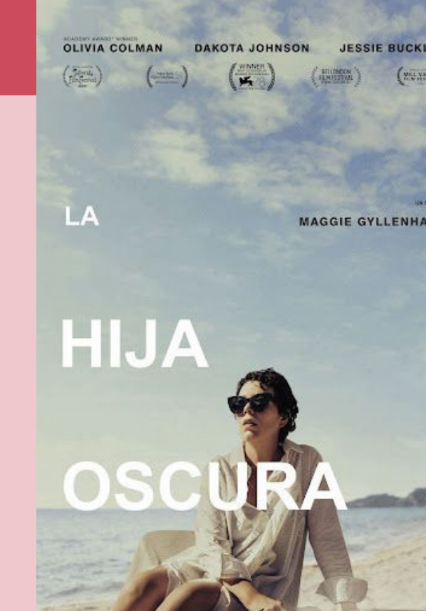
La hija oscura (2021) Maggie Gyllenhaal 121 minutos Clasificación B-15