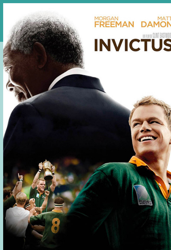
Invictus (2009) Clint Eastwood 135 minutos Clasificación B

En el deporte se presentan temas como la competencia, la inclusión y la discriminación, puede permitirnos reflexionar sobre cómo participamos y somos reconocidos en la vida social.