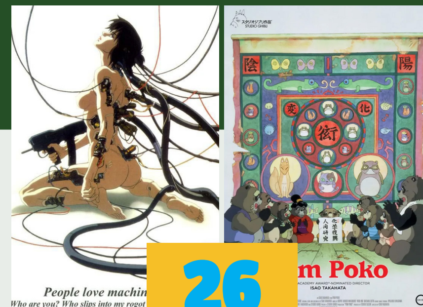
Ghost in the Shell (1995) Mamoru Oshii 83 minutos Clasificación B-15