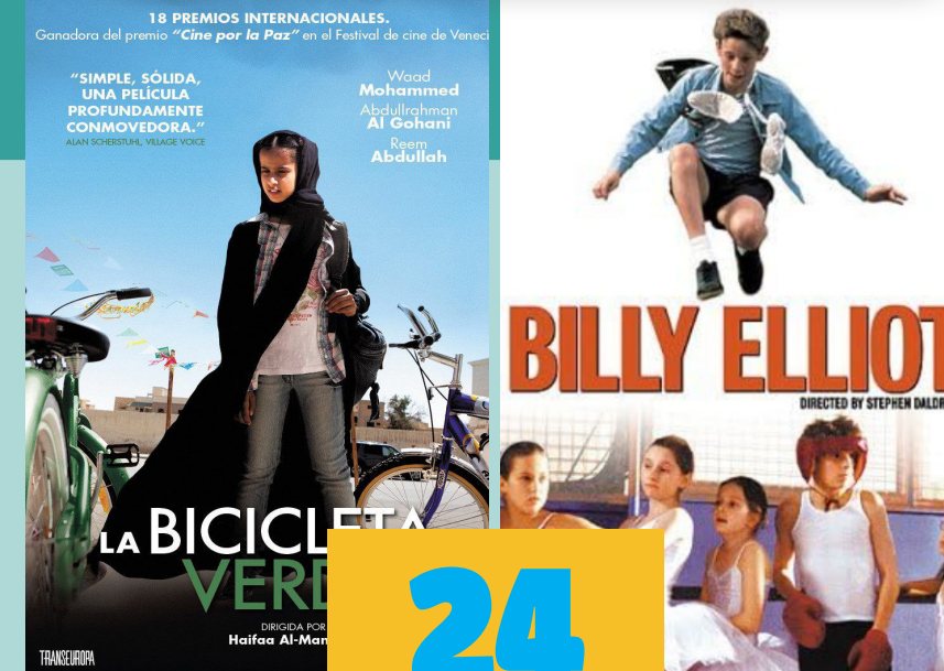
La bicicleta verde (2012) Haifaa al-Mansour 98 minutos Clasificación A