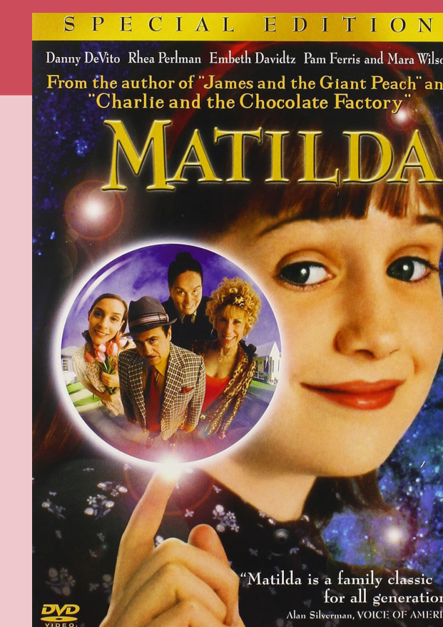
Matilda (1996) Danny DeVito 98 minutos Clasificación A

La familia es donde aprendemos a convivir, a resolver conflictos y a relacionarnos con la autoridad. Lo que pasa en casa puede reflejar lo que pasa en la sociedad.