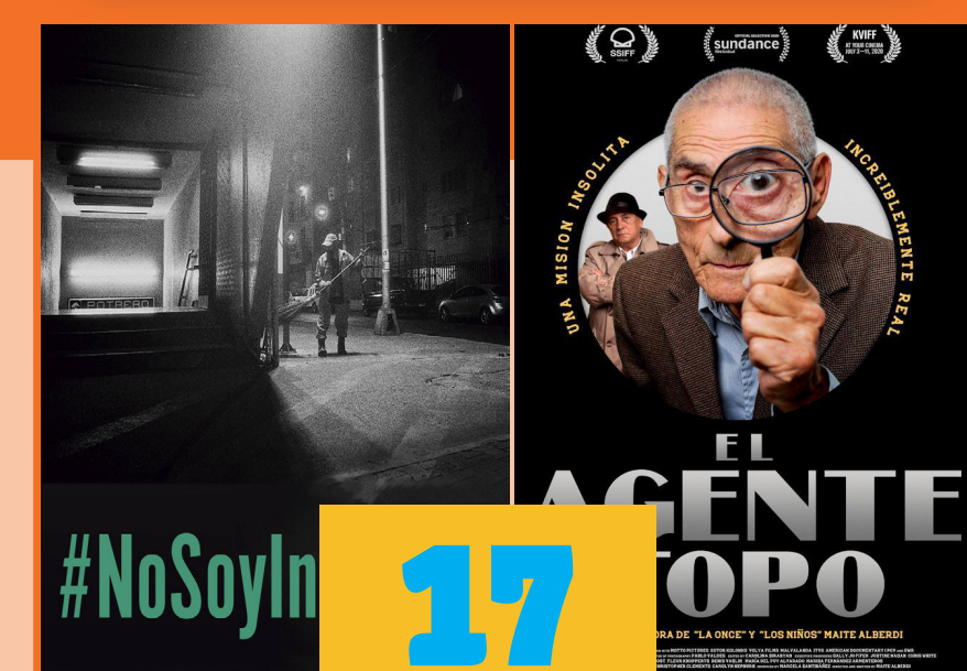
Tratado de invisibilidad (2024) Luciana Kaplan 85 minutos Clasificación B-15